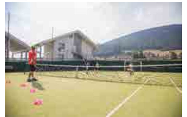
Tennis / Paddle