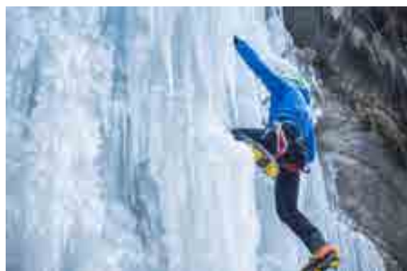
Arrampicata sul ghiaccio