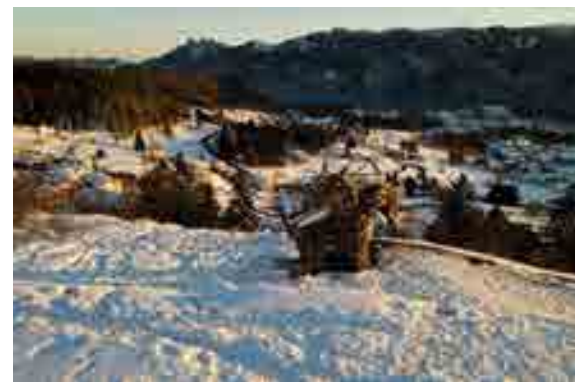
Lavarone Green Land